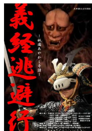
▼イベントフライヤー