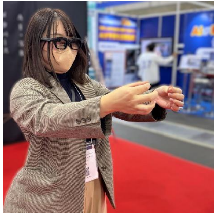
▼展示会場での様子