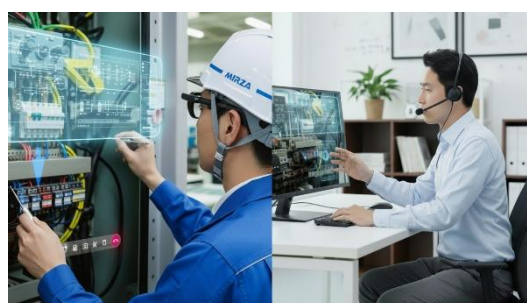
▼製品画像 ・ 作業イメージ