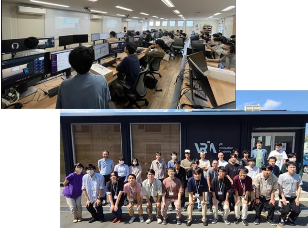
(VRIA 京都の教室と外観)

京都府の太秦メディアパーク構想の一環として、京都府のバックアップのもと、東映京都撮影所内にVRIA 京都を設立。教育機関や企業の DX、リスキリング、人手不足や次世代育成への貢献をビジョンに掲げたアカデミー事業を中心に、技術力・開発力を活かしたソリューション事業や産学公連携の共同研究開発等も行っています。